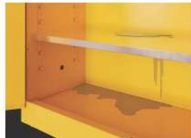
Los derrames se dirigen hacia la parte trasera e inferior del gabinete