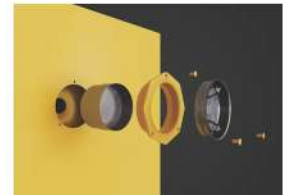
Rejillas de ventilación dobles que permiten la ventilación interna