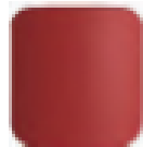
Botón de traba

Accesorios incluidos: Cabezal universal (H-P10431) y funda (APF17TL-1)